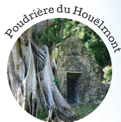
Poudrière du Houëlmont

Le site des Monts Caraïbes s'étend sur 1600 hectares entre les communes de Gourbeyre, Trois-Rivières et Vieux-Fort. Son relief volcanique, ses espèces végétales endémiques et ses vestiges historiques d'origines amérindienne et coloniale lui confèrent un réel intérêt patrimonial. Le Conservatoire du littoral a déjà acquis 253 hectares afin de les protéger de toute urbanisation. Il met en œuvre des actions de valorisation des espaces issues du plan de gestion. Parmi elles, citons la restauration par la commune de la poudrière de Houëlmont qui faisait partie d'un important réseau défensif dans la région de Basse-Terre, mais aussi l'exploitation de terrains en agroforesterie pour reconstituer l'identité paysagère par la culture d'essences fruitières autrefois présentes sur le site.