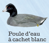
Poule d'eau à cachet blanc