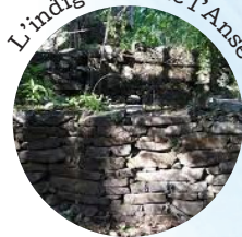
L'indigoterie de l'Anse à Barque